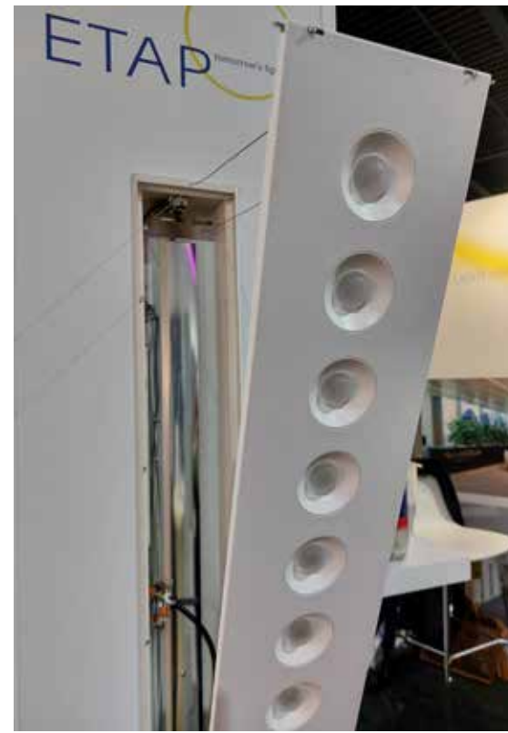
ETAP Lighting International specialiseert zich onder meer in refurbishment.

Een bijzondere presentatie was van Unifit, de partner van besturingssysteem Casambi. Op Future Lighting stond het bedrijf met een tuk-tuk, gevuld met schakel/presentatiemateriaal. "Voor Casambi is dit een nuttige beurs", vertelt