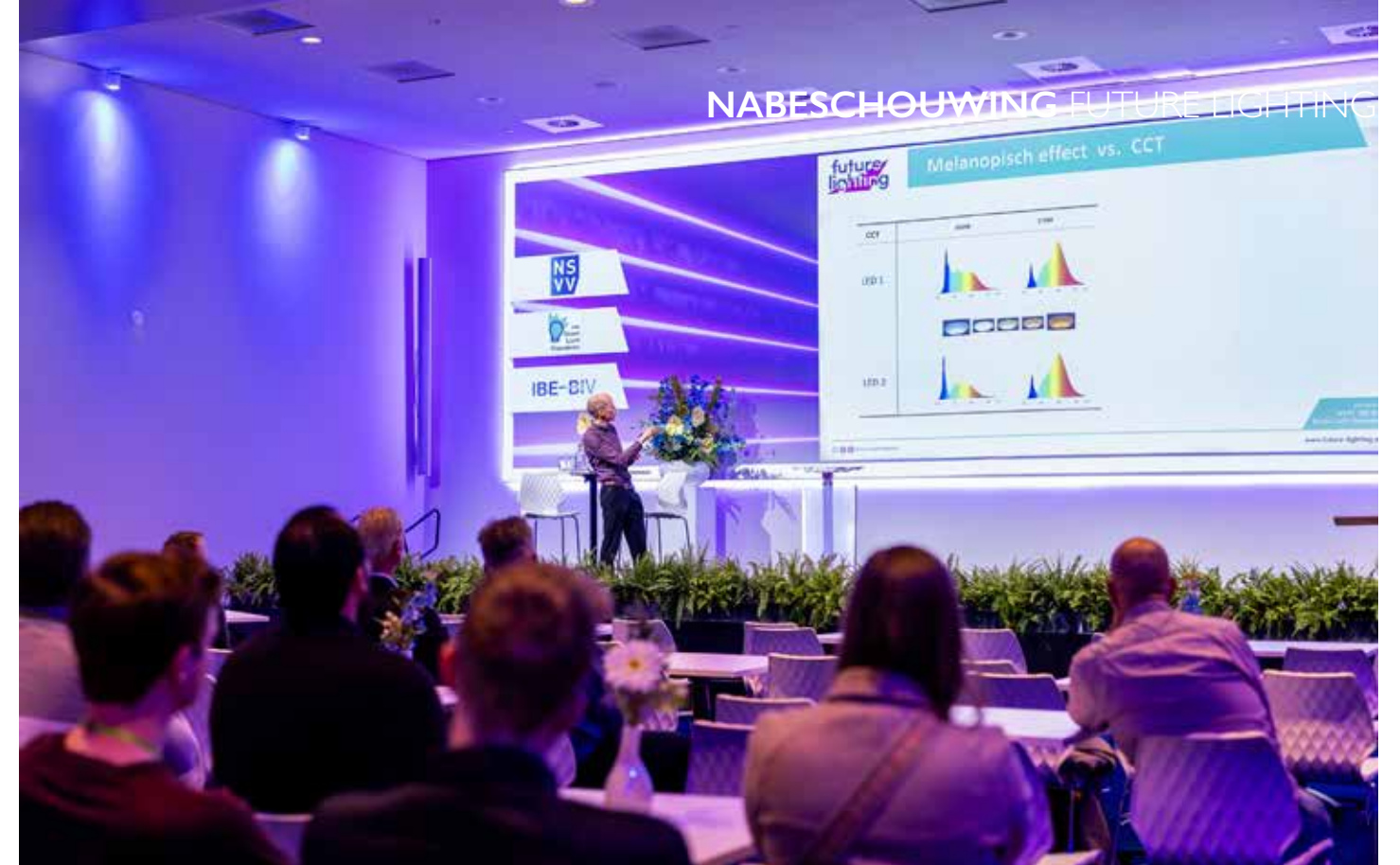
Een interessant lezingenprogramma.

Nieuw op Future Lighting was het 'Lighting Experts Dinner' na afloop van de eerste eventdag. Ruim 80 lichtprofessionals dineerden gezamenlijk en discussieerden over belangrijke stellingen. Het hoofddoel, om collectief de aandacht te vestigen op de rol van 'licht', werd bekrachtigd met handtekeningen van vooraanstaande vertegenwoordigers uit de verlichtingsbranche, vastgelegd op een intentieverklaring. Er werd met elkaar afgesproken hier het komende jaar aan te werken, om tijdens het volgende Lighting Experts Dinner een convenant te tekenen en te overhandigen aan een belangrijke vertegenwoordiger binnen de verlichtingsindustrie of overheid.