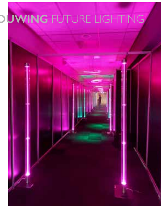
Bezoekers konden aan in de 'aanloop' naar de beurs genieten van mooie verlichting.

'We hebben echte lichtprofessionals ontmoet en goede gesprekken gevoerd'