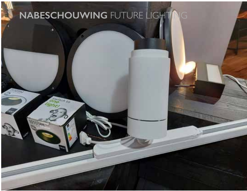
Een nieuw Casambi gestuurd armatuur van Spectrus.

Het bedrijf werkt daarom veel samen met architecten, een doelgroep die Berla Lighting graag nog meer zou willen zien op Future Lighting. "Voor architecten is de lichtkleur belangrijk, net als de lichtsturing. Wij kunnen op beide fronten bieden wat zij zoeken."