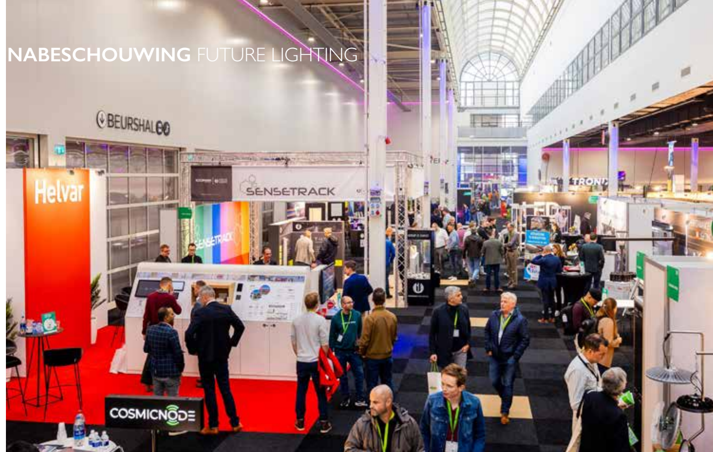
Veel reuring op de beurs.