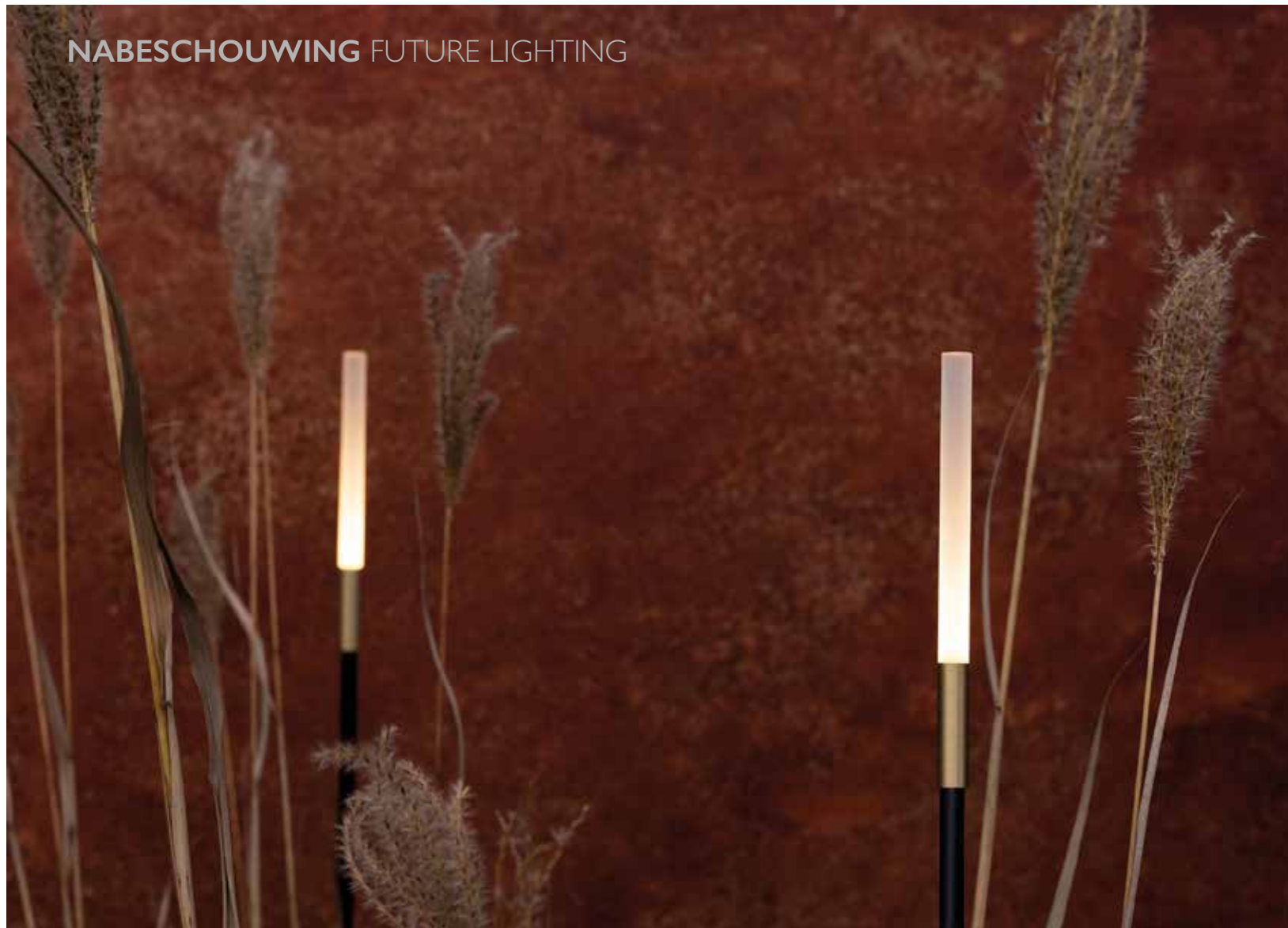
Lymfe, een nieuw armatuur van Lombardo.

Integratech kon even op adem komen met een goed tijdschrift.