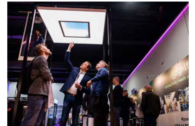
In gesprek over de details.

'Het kloppende hart van de beurs was ook dit jaar de congreszaal waar doorlopend kennissessies werden gehouden door ijzersterke keynotes'