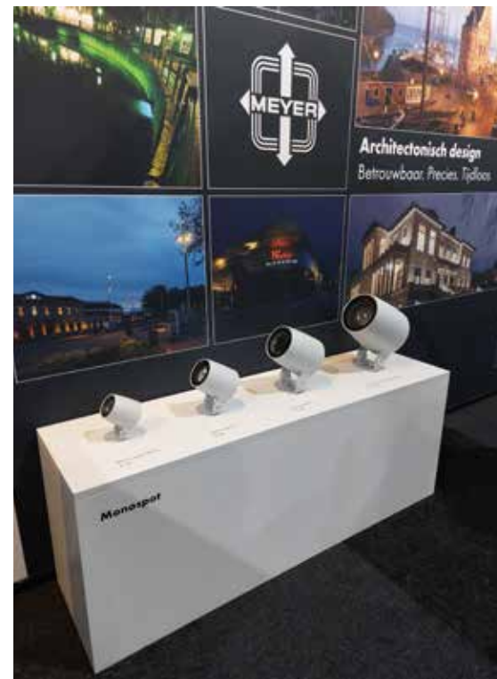
De Monospot serie van Meyer.

'Het evenement heeft ons zeker gebracht wat wij hoopten. Deze editie telde twee keer zoveel exposanten als vorig jaar en werd ook beter bezocht'