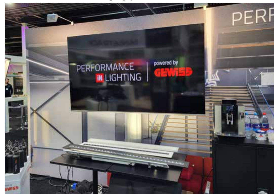
De stand van Performance in Lighting by GEWISS.

Koopman Interlight is al 75 jaar actief als verlichtingsleverancier, maar richt zich de laatste jaren