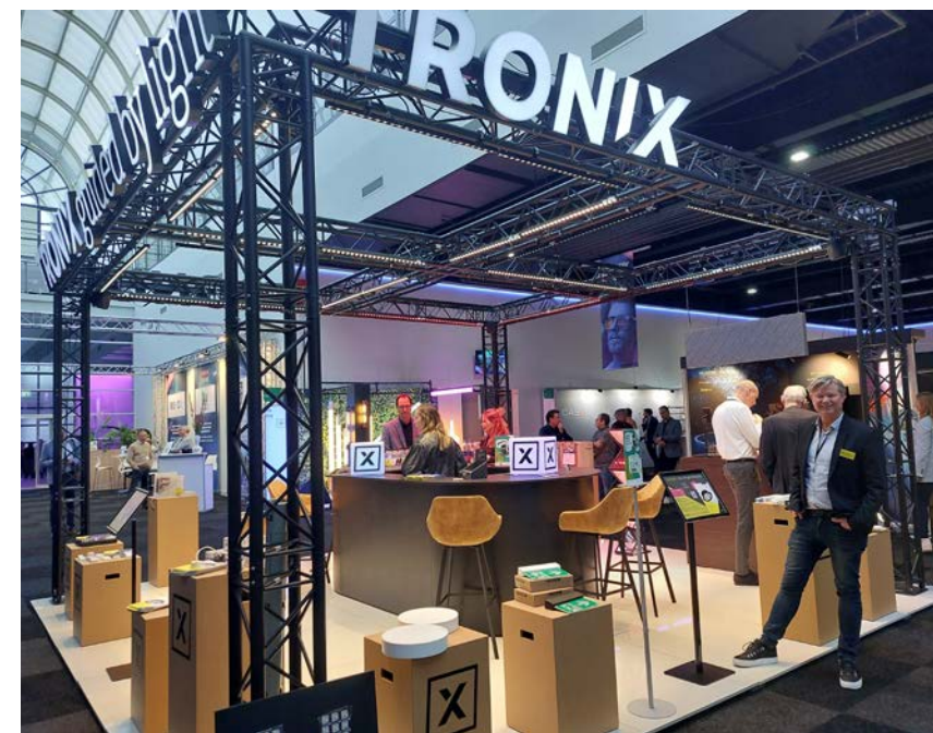
Maarten Verbruggen op de stand van Tronix.