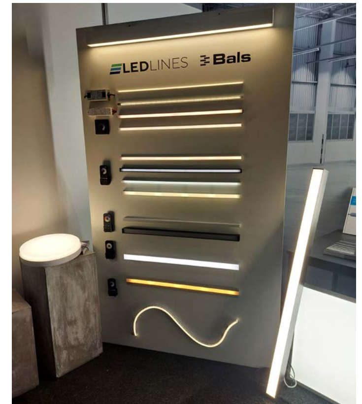
Verschillende armaturen van Ledlines, vertegenwoordigd door Bals.