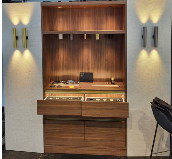
De nieuwe ELYS collectie van Internova kreeg positieve reacties.