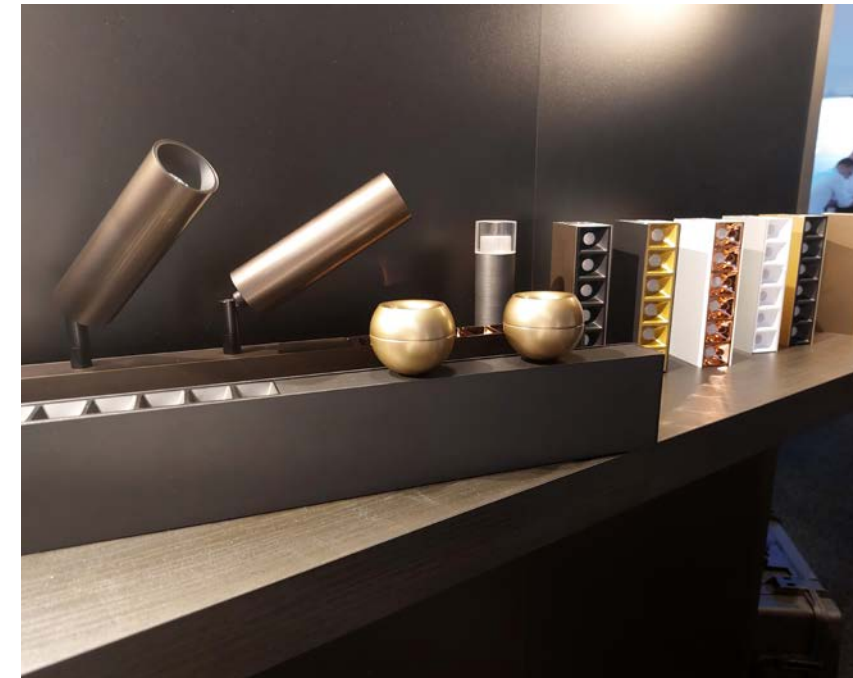
Unlimited Lighting verdeelt ook de armaturen van Exterus.

"Ik heb een goed gevoel over de beurs", zegt directeur Maarten Verbruggen van Tronix . "Ik heb tot nu toe goede gesprekken kunnen voer-