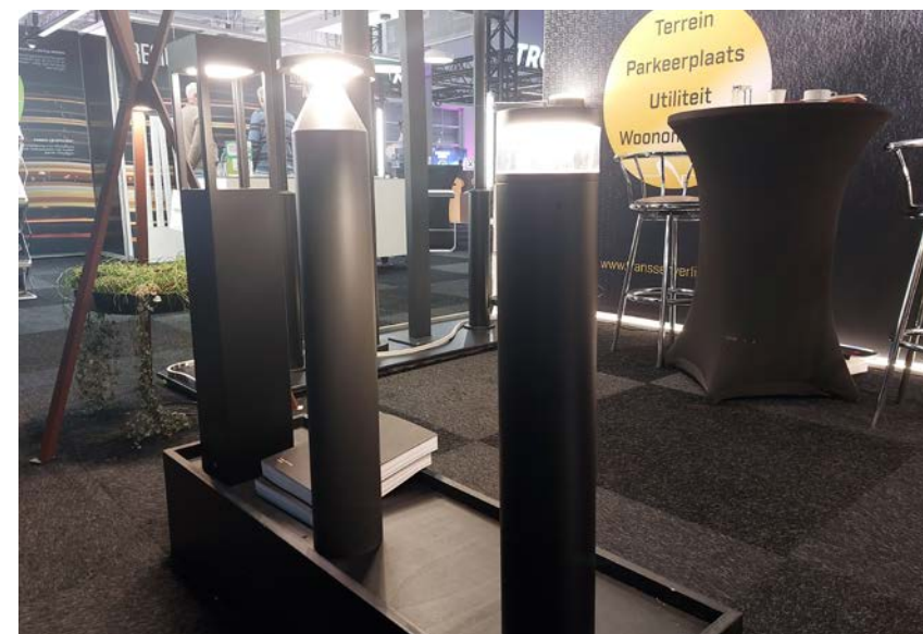
Armatuur Sleek (voorgond) van Franssen Verlichting.