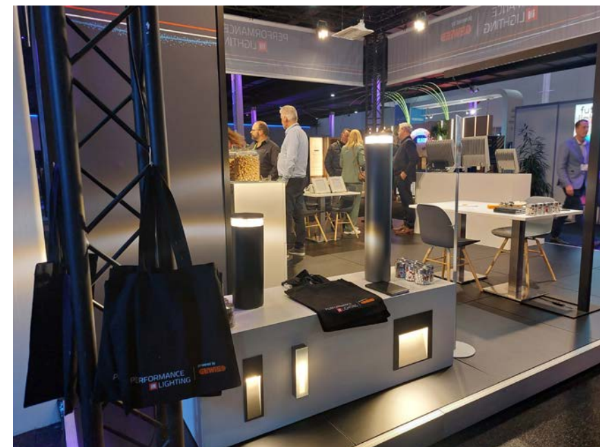
De architecturale INDEX+ outdoorcollectie van Performance in Lighting.

PERFORMANCE IN LIGHTING toonde verschillende noviteiten in Gorinchem, zoals de vernieuwde FlexiLed-collectie, waaraan pendelarmaturen en schijnwerpers zijn toegevoegd. Ook nieuw was de architecturale INDEX+ outdoorcollectie. Het bedrijf heeft hierin de verspreiding van het licht gemaximaliseerd, terwijl het compacte ontwerp van het product behouden blijft.