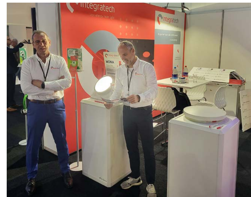
De vertegenwoordigers van Integratech bij armatuur Mona.